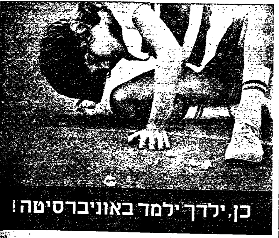
כנ ילדך ילמד באוניברסיטה!

בפולי תחנות הדלק: המשבר החדש ירידה במכירות, עמלה זעומה, צ'קים חוזרים, יותר עבודה